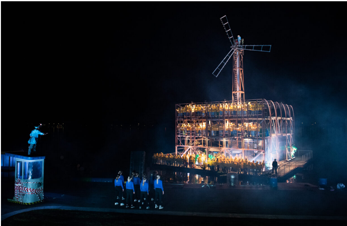
SCHOONSCHIP Opening Floriade EXPO 2022

SCHOONSCHIP aftermovie: https://youtu.be/iOTZKLJ1fYo