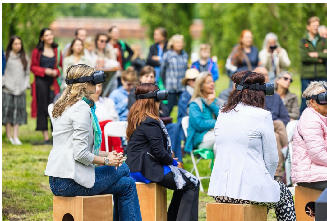
Tijdens de première van 'Almere 100 jaar'