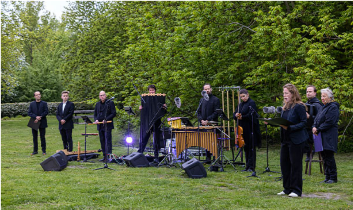
Black Pencil, samen met Suburbia acteurs, 04 mei 2022